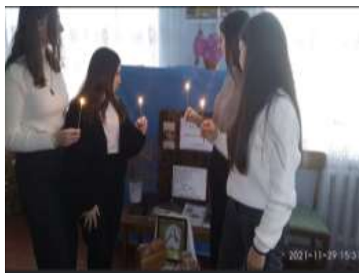
День пам'яті жертв Голодоморів.

До роковин трагедій у бібліотеці організована книжкова ілюстрована виставка "Бабин яр: біль нашої пам'яті"