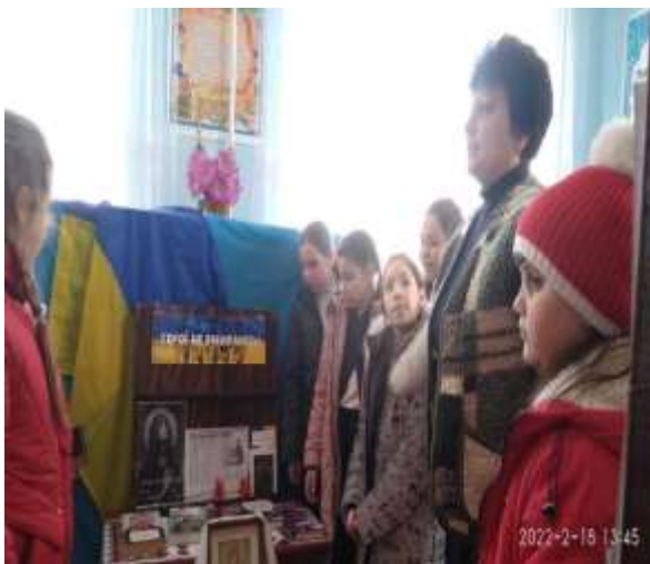
Патріотична година «Моя країна-Україна».