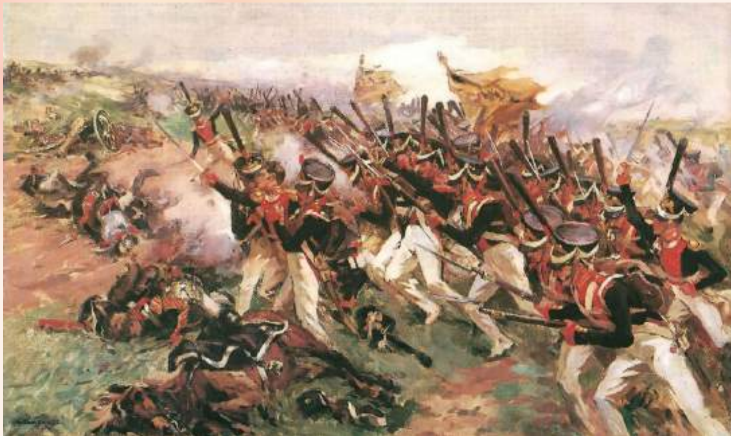
Ілюстрація з серії Наполеонівської війни

Шлях надбання художньої освіти почався з того, що майбутній митець став відвідувати студії академіка живопису Миколи Семеновича Самокиша.