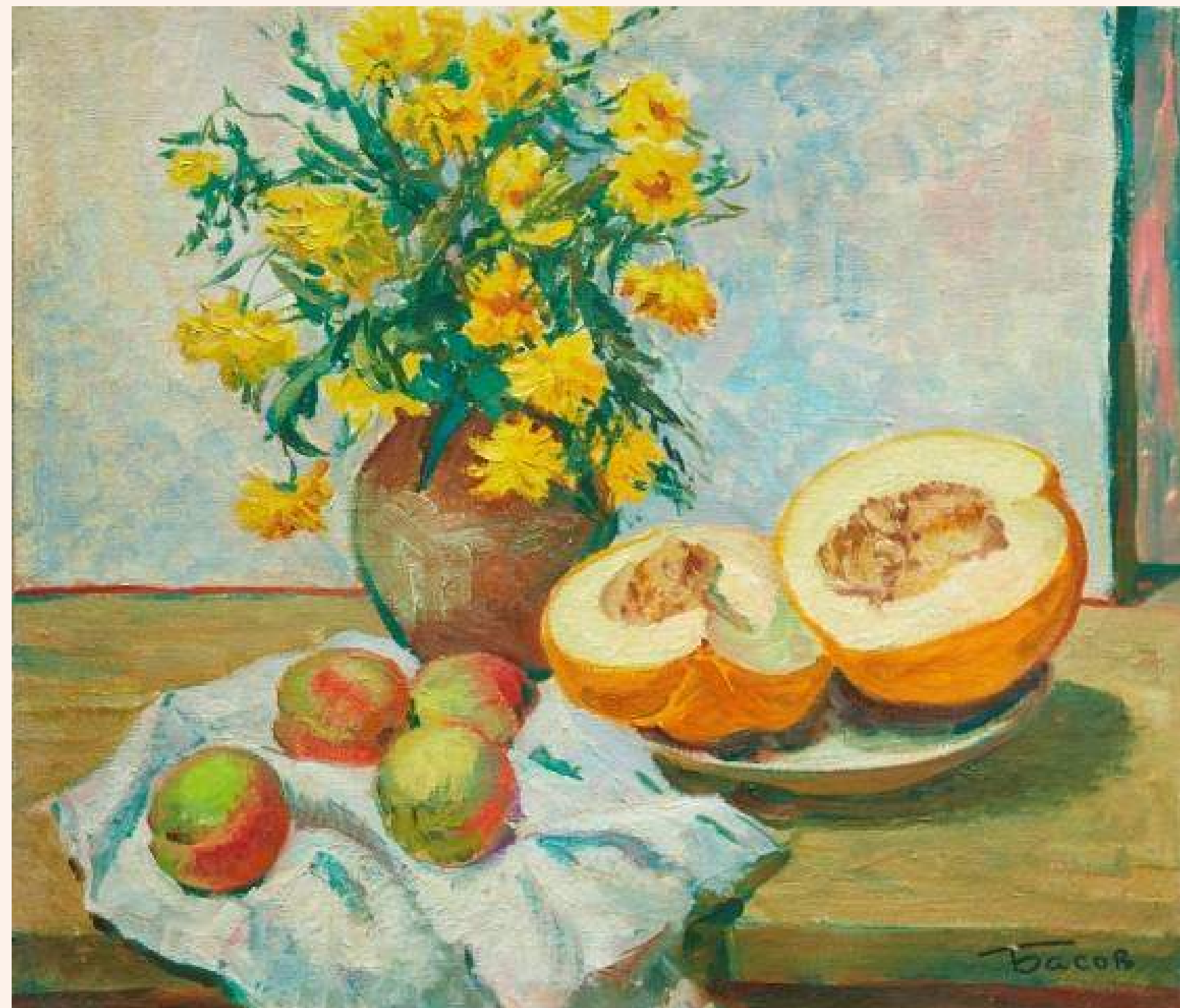
«Натюрморт із динями»