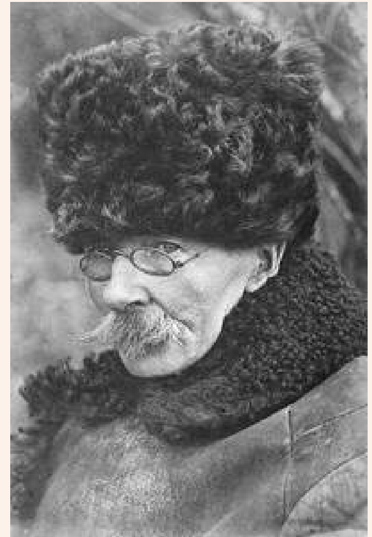
Микола Семенович Самокиш (1860 – 1944) – український художник- баталіст, майстер анімалістичного жанру, графік і педагог.