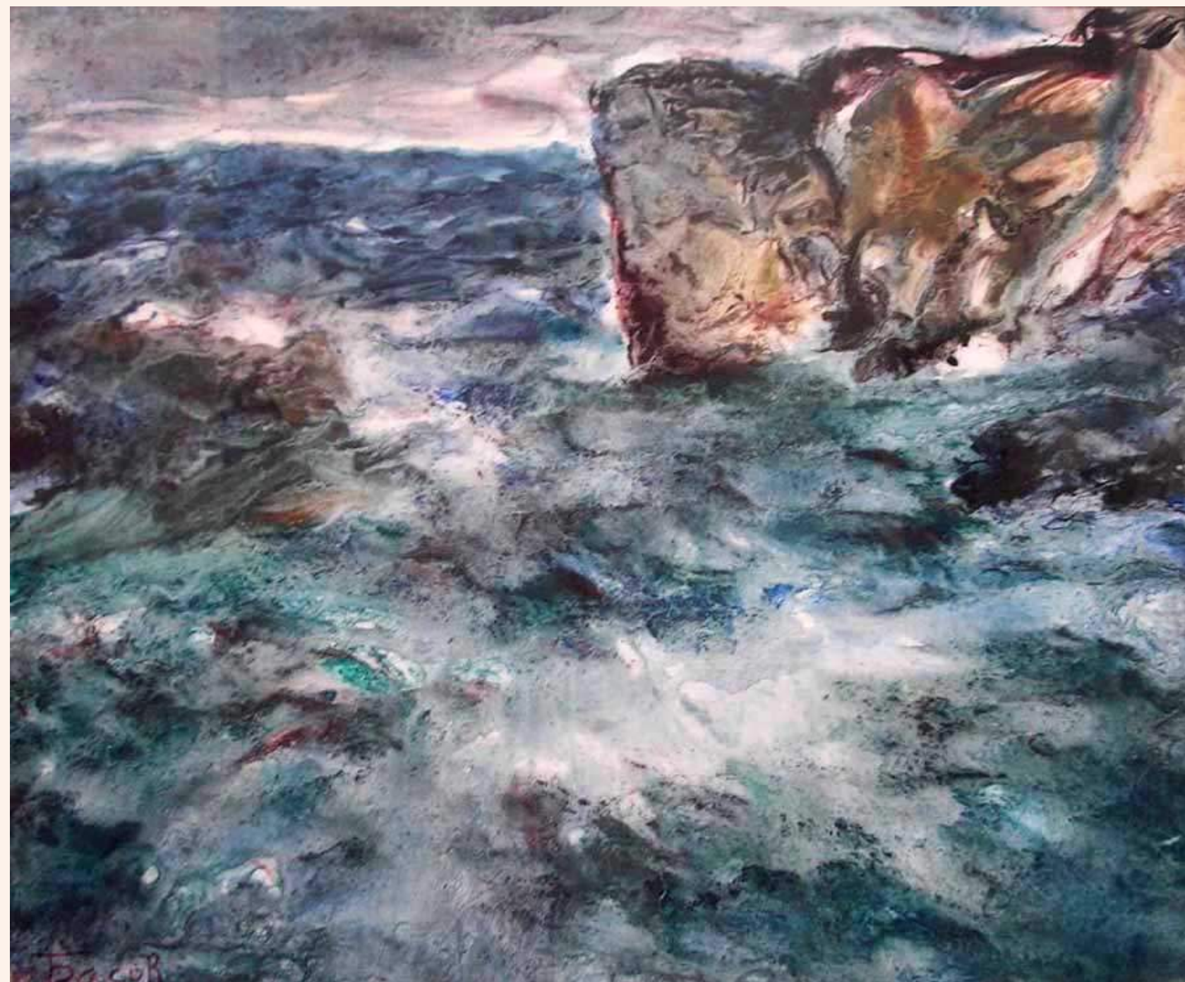
«Море та скелі»