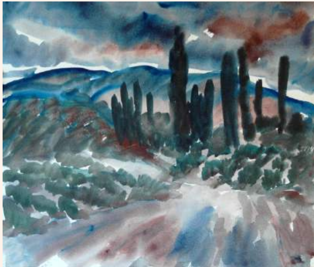
«Тополі в передгір'ї Криму»