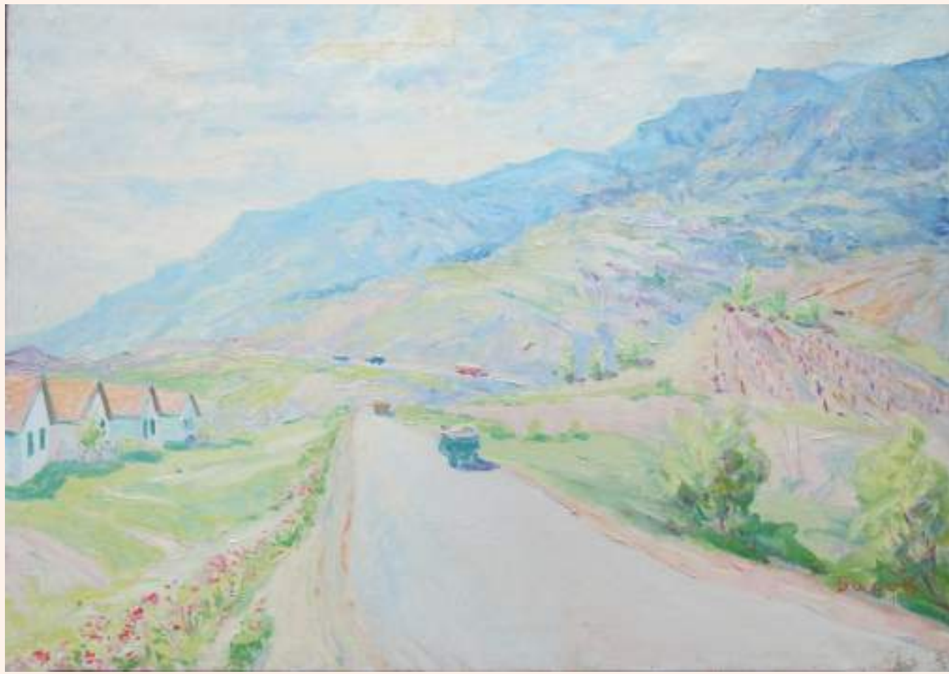
«Дорога на Ялту»