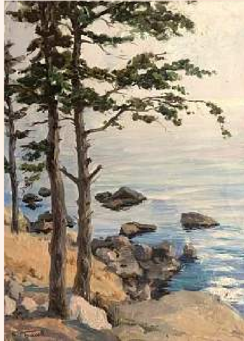
«Сосни над морем»