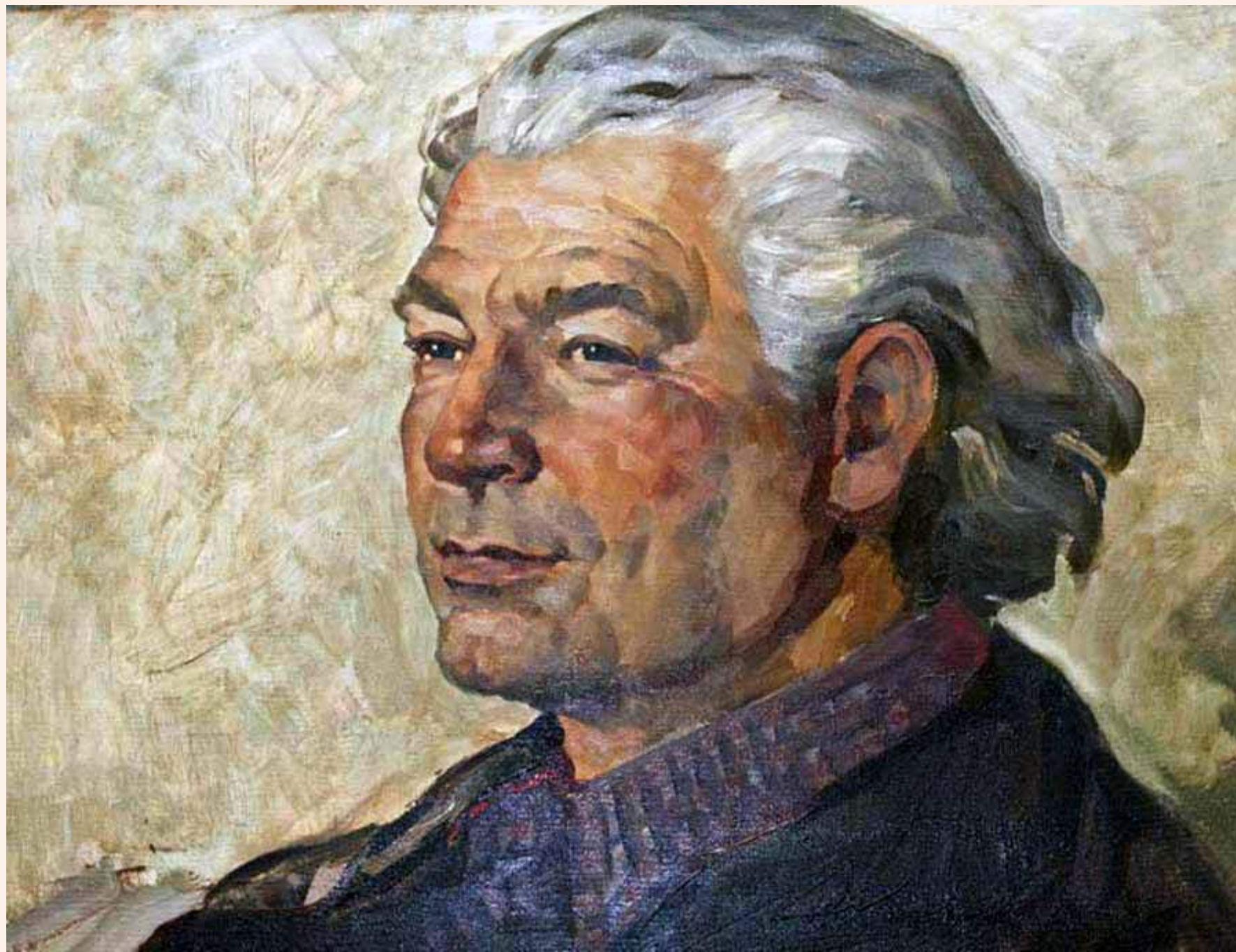
Яків Басов, портрет роботи Г. Брусенцова

Яків Басов помер 16 березня 2004 року в Алупці на 91-му році життя.