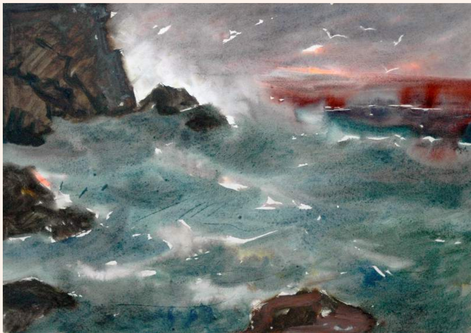
«Чайки над морем»

Понад 100 робіт знаходяться в збірках 42 музеїв України і за кордоном, та понад 600 робіт були передані художником різним музеям Криму.