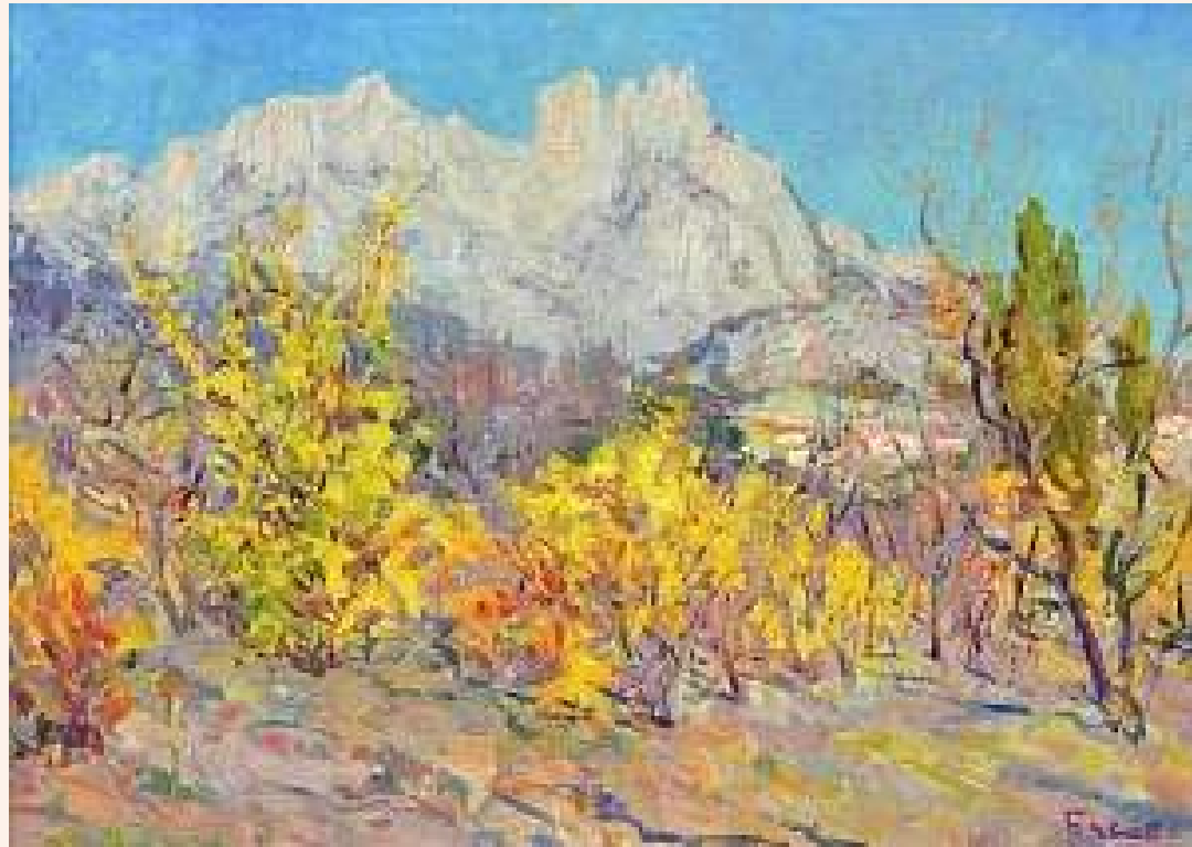
«Осінь в Криму»

Більшість його творінь - це кримські краєвиди, море, гори, рибальські судна, портрети кримчан, південні натюрморти.