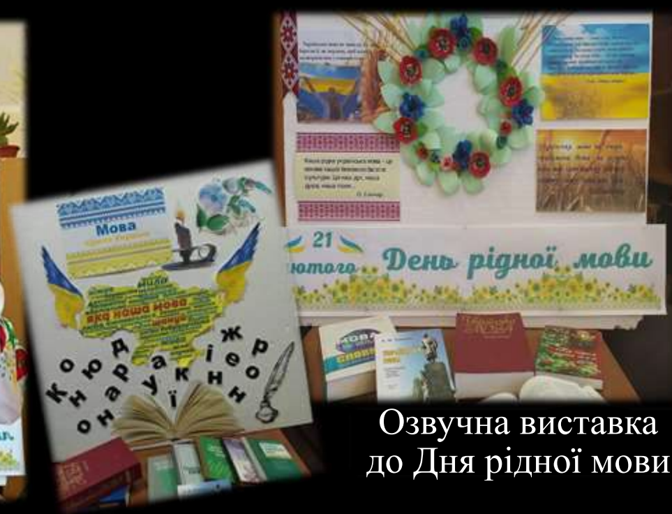
Озвучна виставка до Дня рідної мови