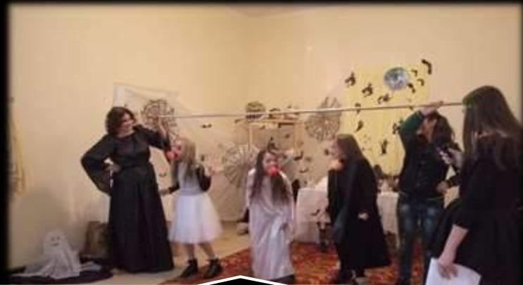
Страшно цікава вечірка до дня Хелловіна