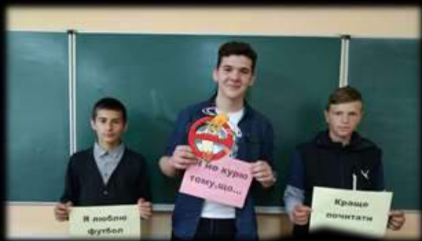
Тайм-діалог до Всесвітнього дня боротьби з тютюнопалінням