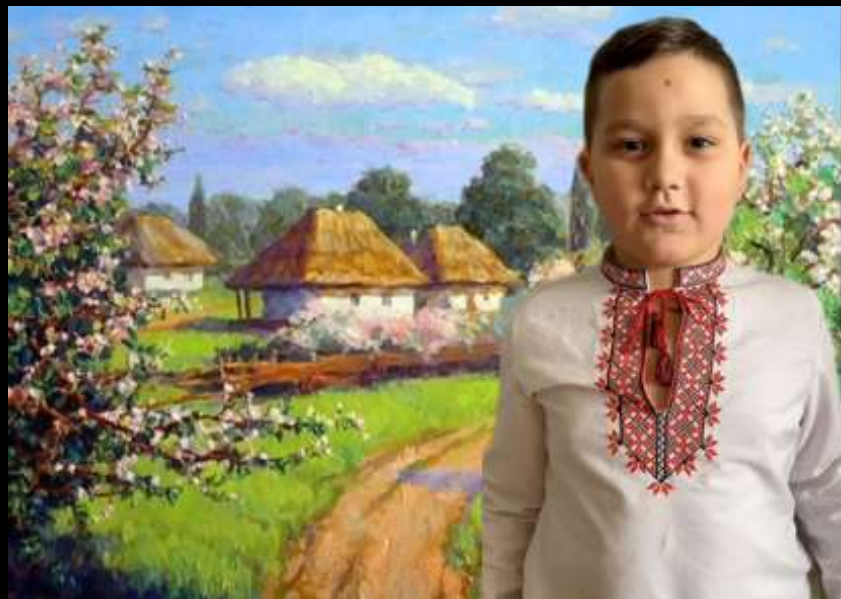
Голосні читання до Дня народження Т. Г. Шевченка та до національного тижня читання поезії