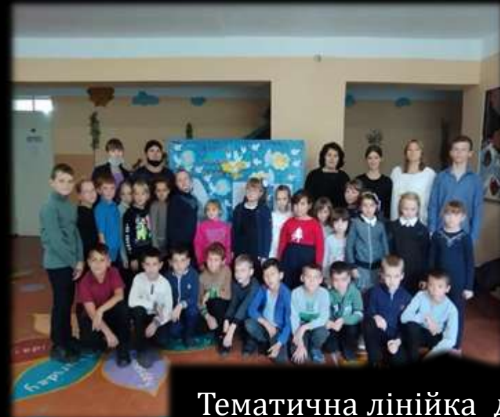
Тематична лінійка до Міжнародного дня миру