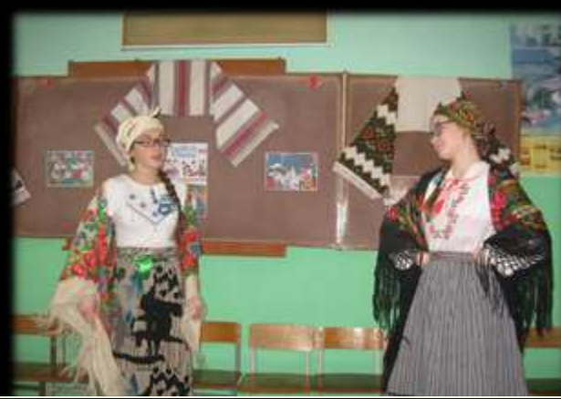
та до Андріївських вечорниць