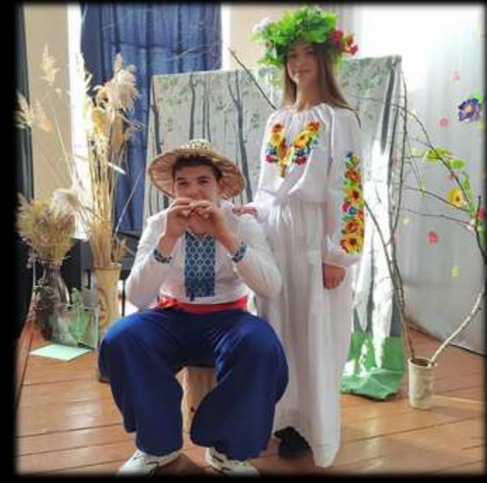
Літературна мініатюра до Дня народження Лесі Українки