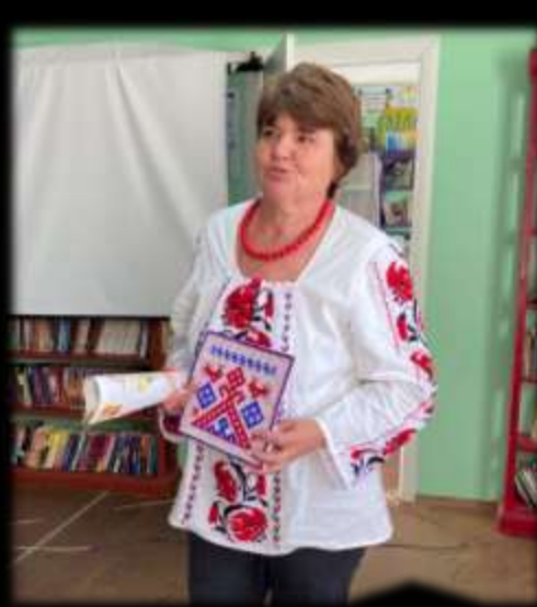
Зустріч з майстриною до Міжнародного дня вишивальниць