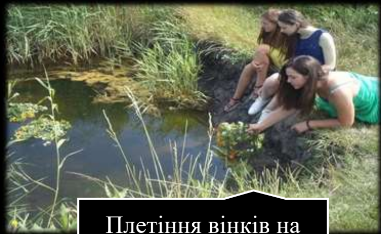
Плетіння вінків на Івана Купала