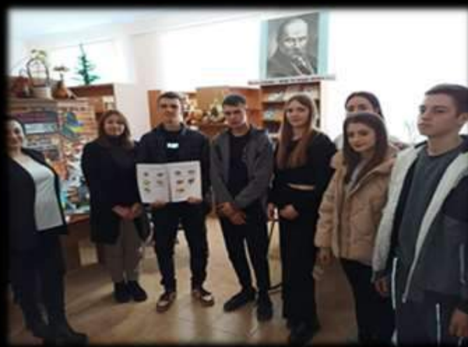
Мовознавче кафе до Дня рідної мови