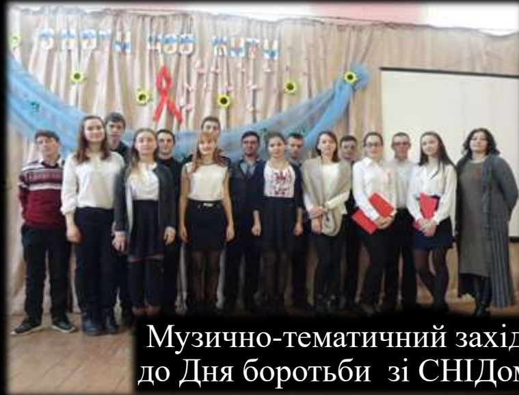
Музично-тематичний захід до Дня боротьби зі СНІДом