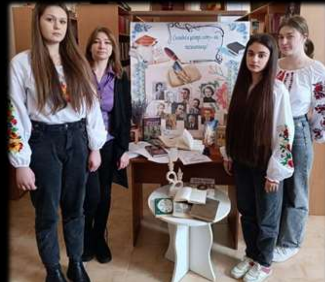
Читання вголос до Всесвітнього дня письменника