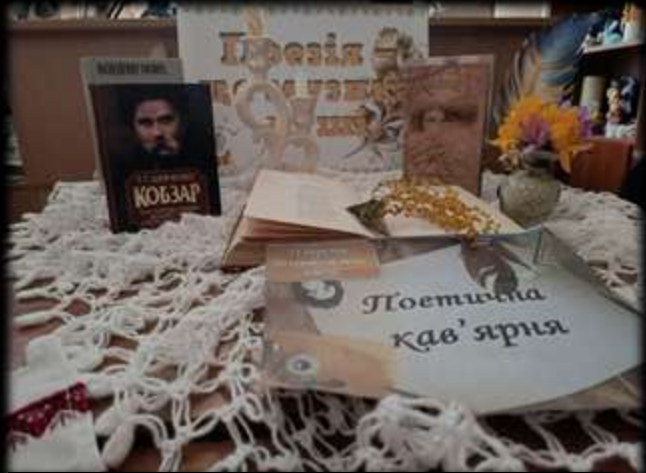
Поетична кав'ярня - посиденьки коліжанок до Дня поезії