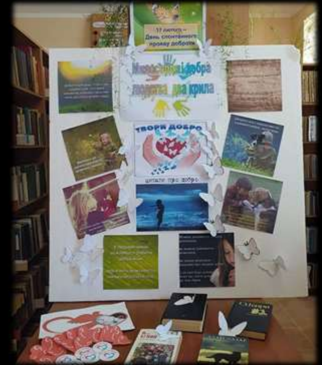
Акція-стіна доброти до Дня спонтанного прояву доброти