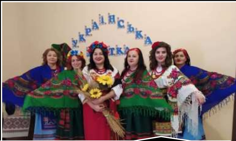
Українські фольклорні вечори до Дня української хустки