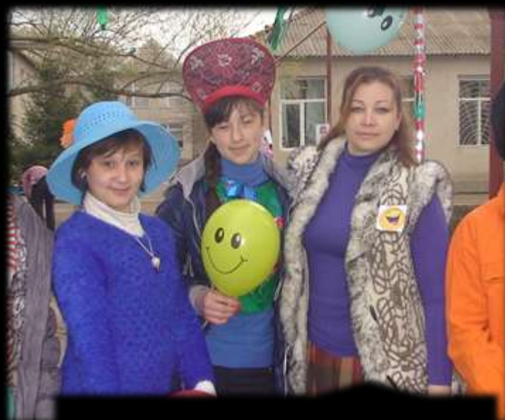
День веселих витівок до Дня сміху