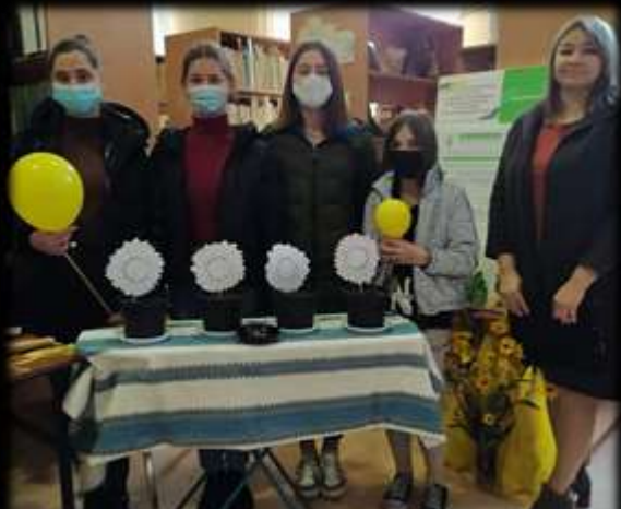
Тематичний захід до Дня відповідальності людини в Україні