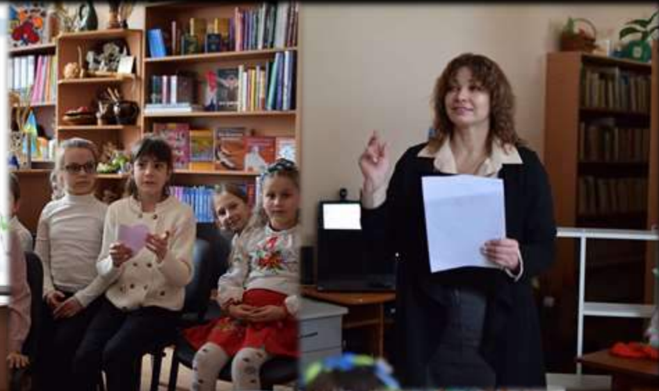
Весняна казкотерапія до Всесвітнього дня казки